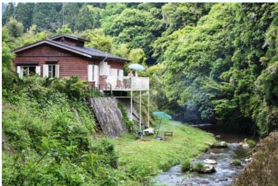
コスモ山荘とバーベキュー会場 (川原)