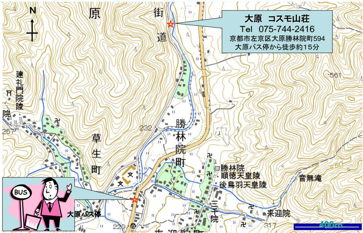
地図 大原とコスモ山荘