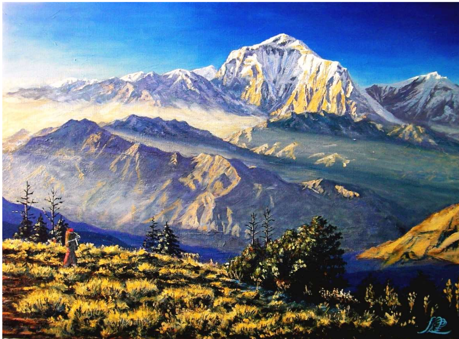
pic.16 ゴラパニ峠からのダウラギリ峰夕照 P 20号 2006

ポカラから2日のトレッキングでゴラパニに登りついた。峠の反対側のダウラギリが出迎えてくる。カリガンダキ川の深い谷を隔てて、王者のような巨峰が夕陽に映えている。壮大な風景の中、荷物を背負った一人の女性が家路を急ぐ。