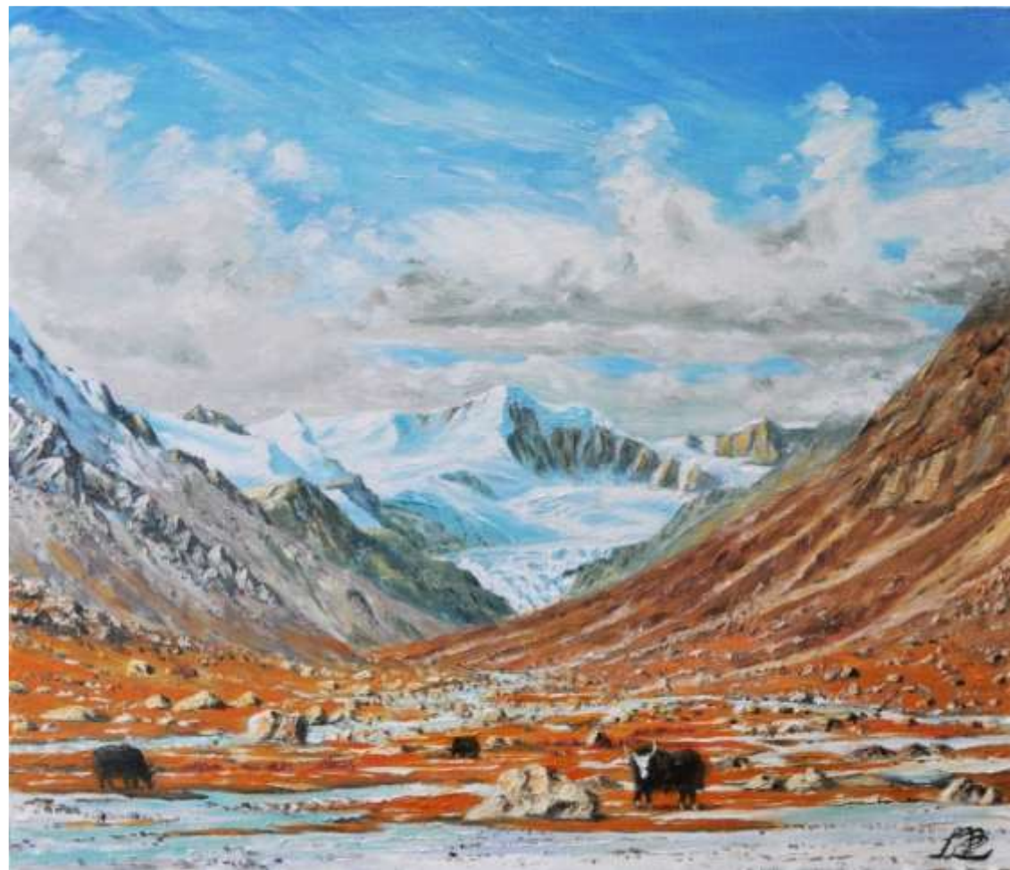
pic.15 バダ谷にて F 10号 2016

チベットのニエンチェンタンラ西山群 ナツ村の仮ベースキャンプからバダ谷を遡る。氷河湖跡を過ぎると見事なU字谷となり、赤くなった草紅葉の上に氷河が運んできた迷子岩が点在する、まるで庭園のような美しい場所となる。谷の奥には氷河を頂いたバダリV峰が望める。