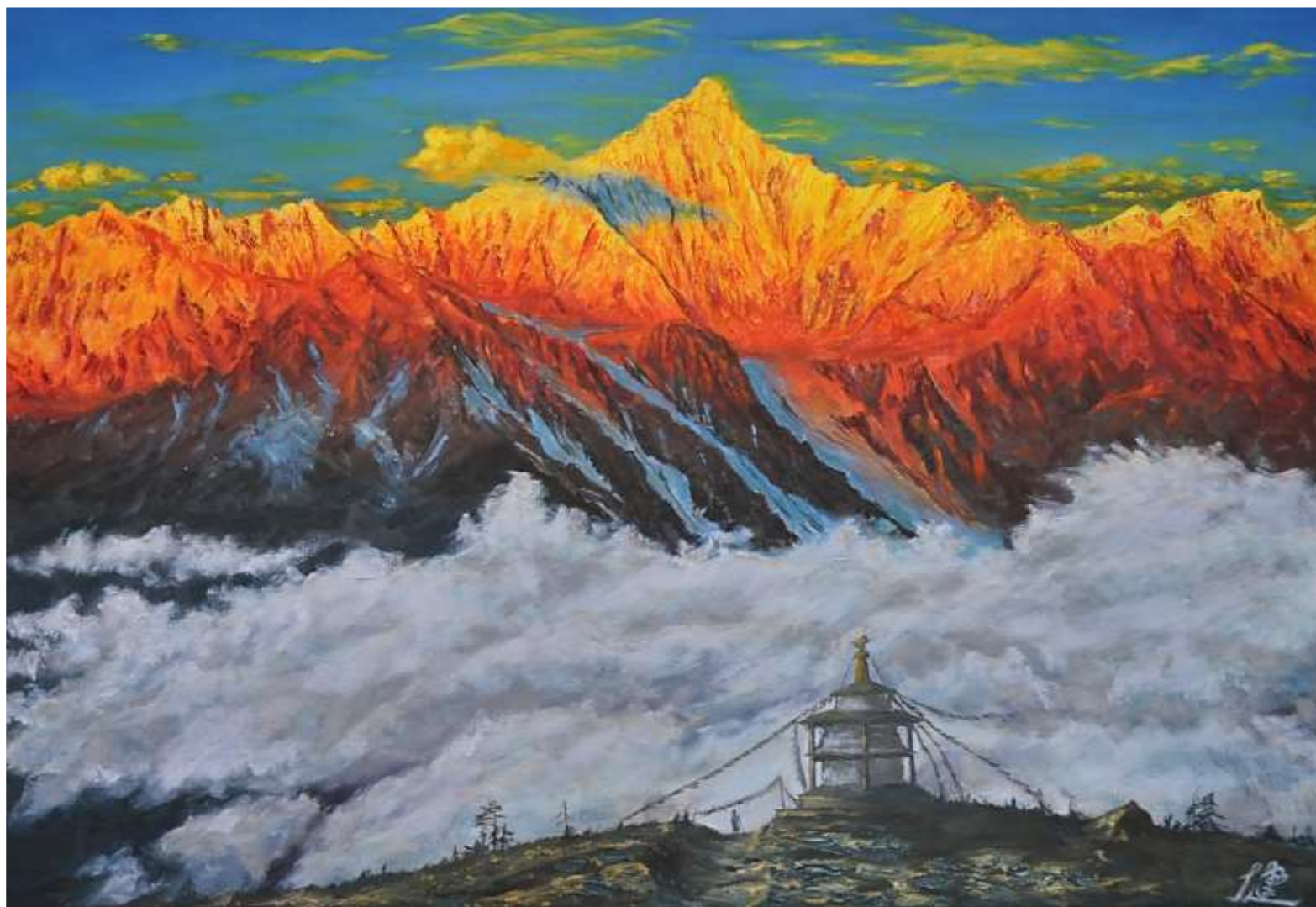
pic.18 チベットの神山に祈る M 20号 2019

メコン川の深く浸食された谷を隔てて対岸に聳える梅里雪山の主峰カワカブ。チベットの人々が神の山として崇める山。早暁に陽の光を受けて燃えるように輝くときは誠に神々しい。ラマ教のチョルテン（仏塔）の傍らで静かに祈る人ひとり。