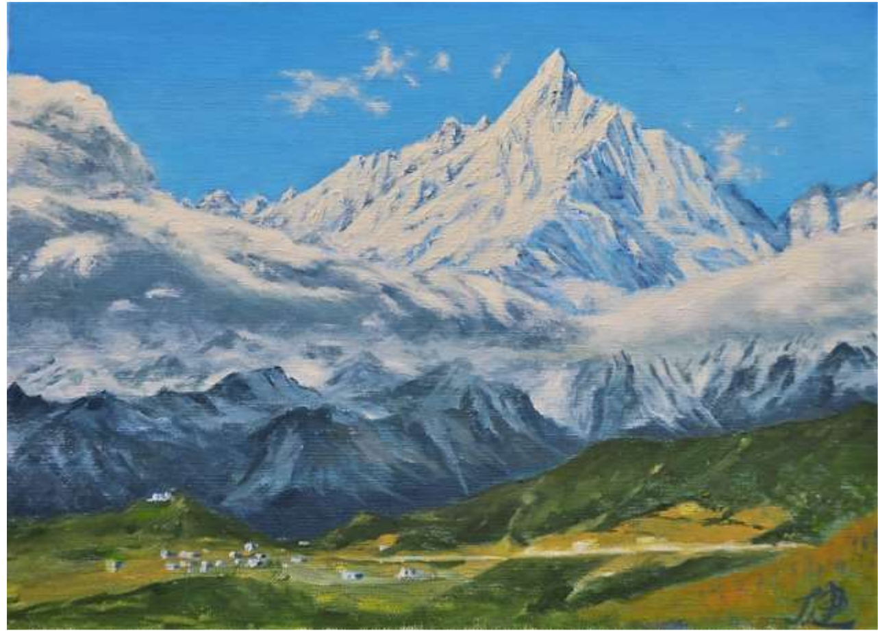
pic. 20 秀麗 F 4号 2020

飛來寺を去る日に、それまで雲に覆われて見えなかったメツモ峰が姿を現した。現地の人たちはカワカブを男神と見立てて、その妃の峰とされている。凛として鋭く天を突くように立っている姿は気品さえ感じさせる素晴らしい山である。