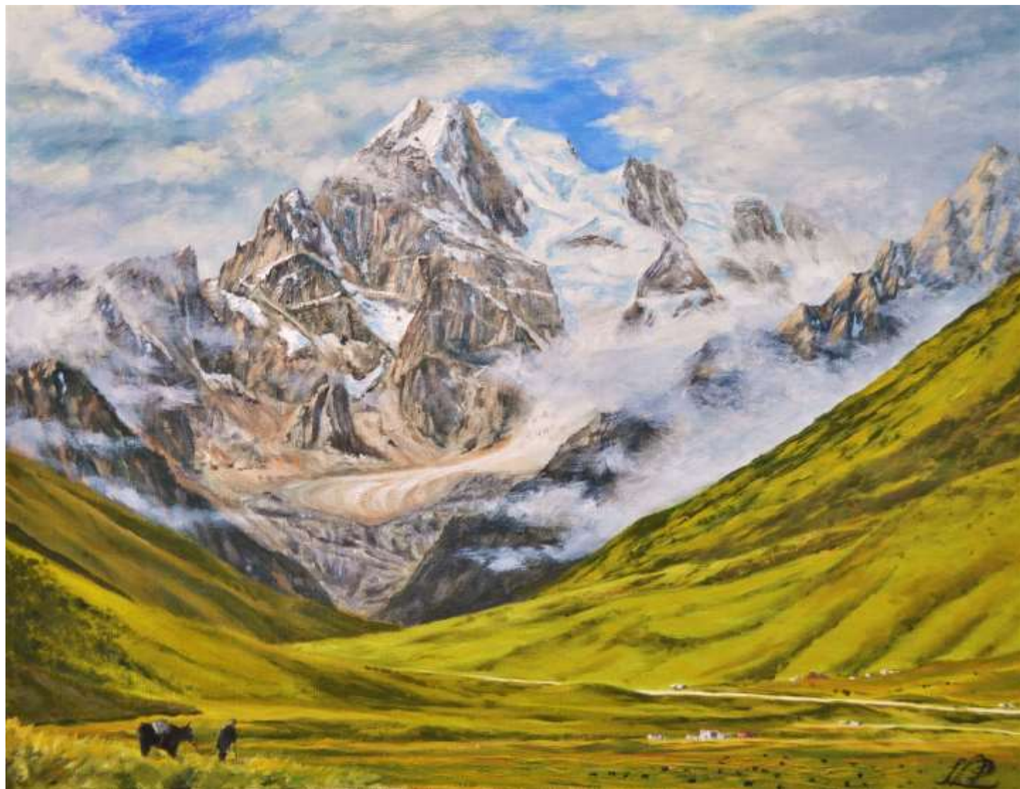
pic. 21 草原の果てのジャラリ P 10号 2020

初登頂から30年を経て訪れた我々の前にジャラリが姿を現した。マニカングの街を出ると氷河を懸けた巨大な岩山が突如草原から湧き出たように鎮座していた。