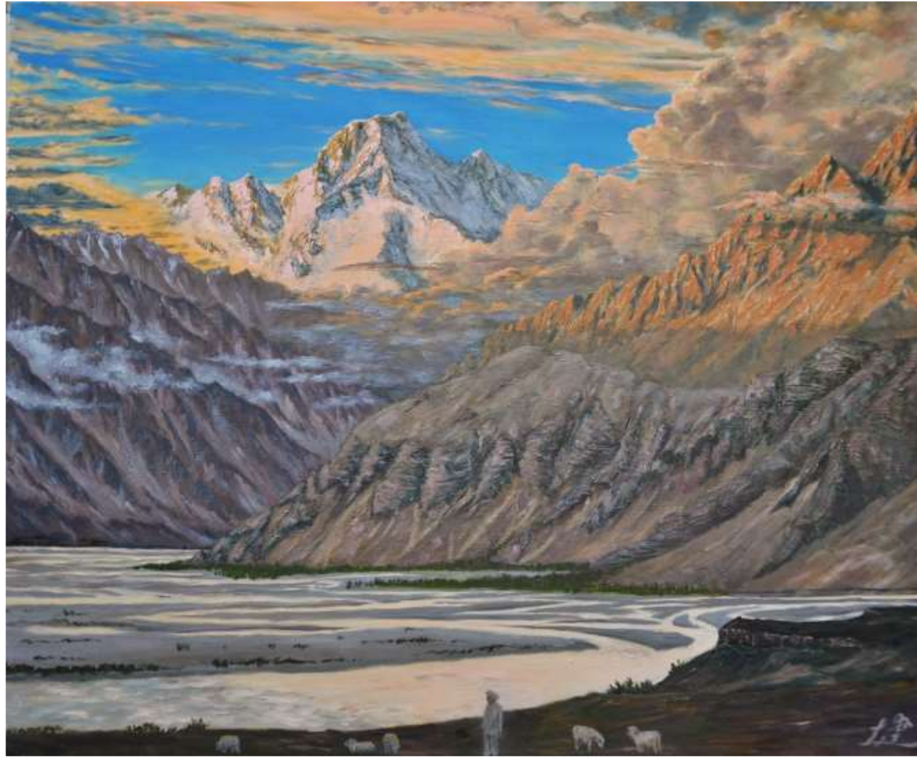
pic. 1 ショーク河畔にて F 20号 2019

インダス河支流ショーク河畔のオアシス・スルモ。その背後の河岸段丘の上に立つと、フーシェ谷の奥にカラコルムの巨峰マッシュブルムの神々しい姿が望めた。昼間は無味乾燥な褐色の世界が黄昏時には一瞬色彩豊かに輝く。日本を遠く離れて僻遠の地で見た景色である。