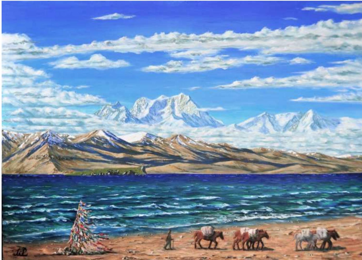
pic. 2 天上の湖から天帝の峰を望む P 30 号 2015

小さな峠を越えると標高 5000mにある天上の湖ブマユム・ツォの湖畔に出た。南方に目指す天帝の峰・クーラカンリを初めて肉眼でとらえた。やっとここまで来たかと感慨ひとしおであった。