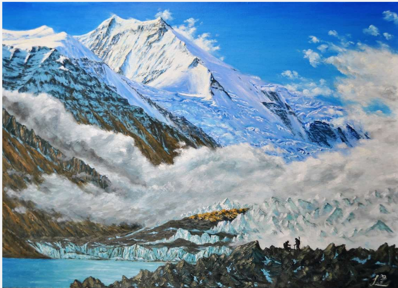
pic. 3 空へ P 30号 2018

西氷河末端の凍結した氷河湖から登山を開始した。早朝、エンドモレーンの上に立つ。氷河から膨大なセラックが押し寄せ、そして抜けるような蒼い空高くこれから登ろうとしている西稜とクーラカンリ頂上が望めた。圧倒的な大自然を前に我々はなんと小さい存在であろうか。