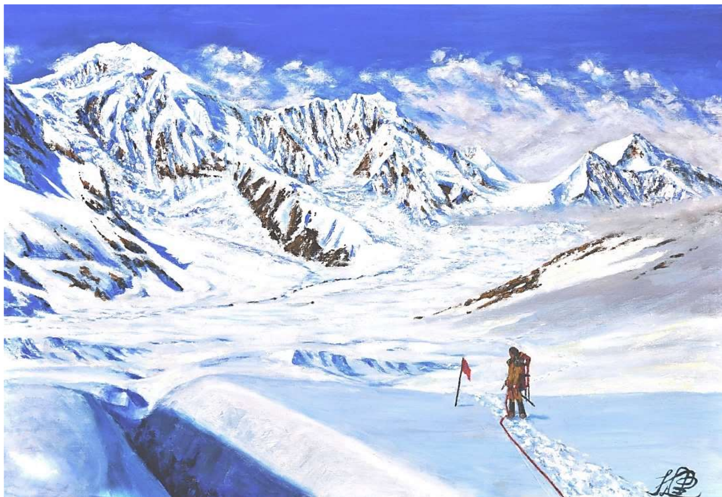
pic. 6 アタ氷河の偵察を終えて M 20号 2009

ルオニイとそれに続くKG 2、KG 3の偵察を終えて、キャンプへ引き返す。午後になってガスが湧き始めた。来るべき日の再会を期して山々を振り返り、別れを告げた。