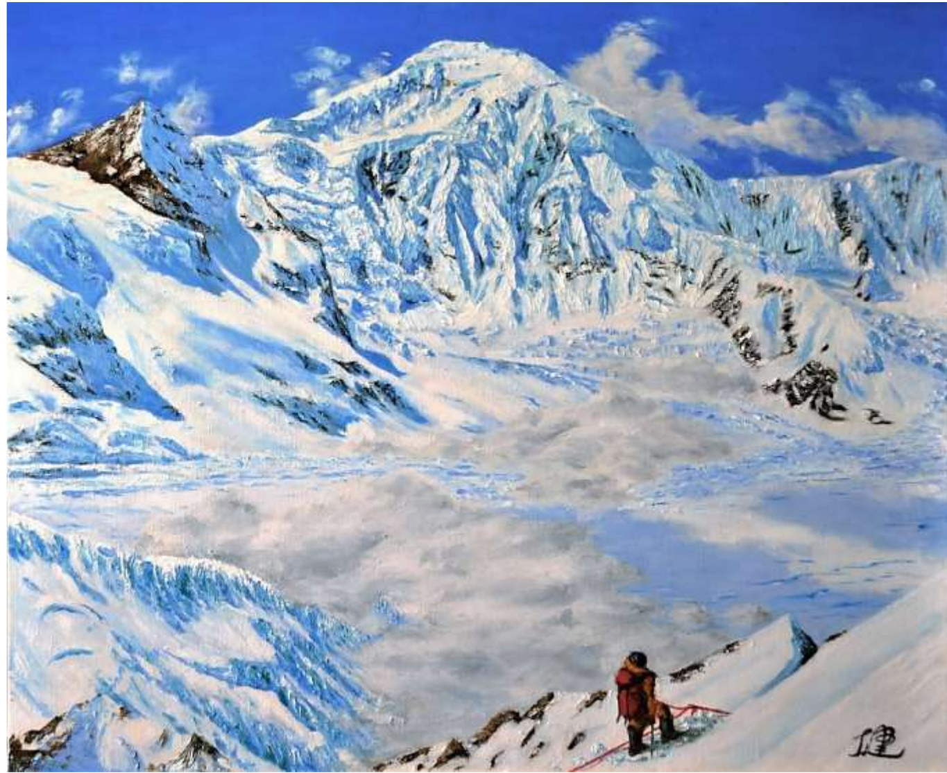
pic. 5 KG2との出会い F 20号 2013

久しぶりの晴れ間を利用してアタ氷河の偵察を行う。氷河北岸の山腹に登ると、対岸にカンリガルボ山群で最も高い稜線上に巨大なKG2が見えた。「あれに登ろう！」とその時思った。この2年後にそれが実現することになる。