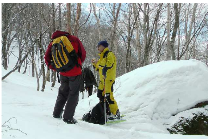
小鷲山南の谷筋で休憩

雨や日照りで硬くなった雪面にほんの少し新雪が積って多少滑りやすくなったコンディション