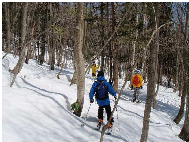
手入れの悪い杉林に入ると滑りにくい。