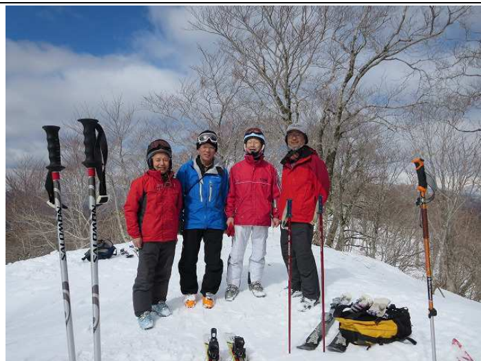
小鷲山 1403.1m 頂上にて