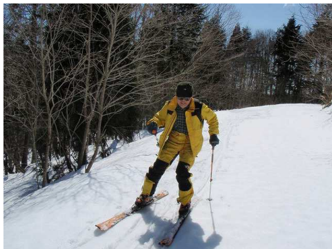
西ウレ峠へ林道を下る (22日の特訓で見違えるように上達した居谷)