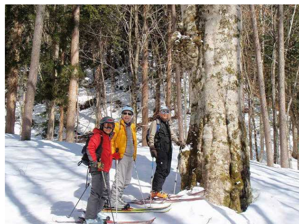
西ウレ山登山道 A・コース入口からすぐにある大樫

雨や日照りで硬くなった雪面にほんの少し新雪が積って多少滑りやすくなったコンディション