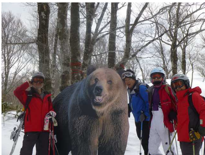
ホワイトピア高鷲リフト頂上のヒグマ