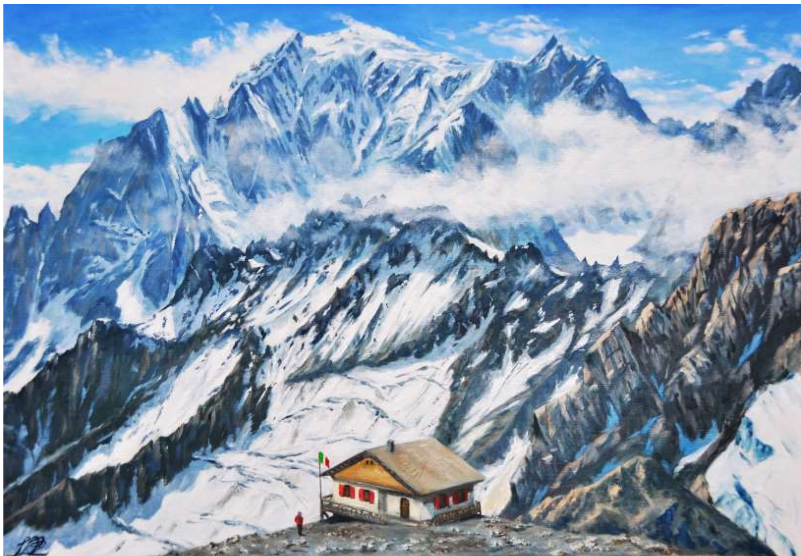
pic.32 エルブロンネからのモンブラン・イタリア側 M 20号 2020

エルブロンネから見るモンブランのイタリア側は、比較的茫洋とした氷河が続くフランス側と打って変わって荒々しい岩壁が一気に落ちている。その上に清浄な純白のドームが雪煙をたなびかせる。ヨーロッパアルプス最高所・モンブラン頂上である。