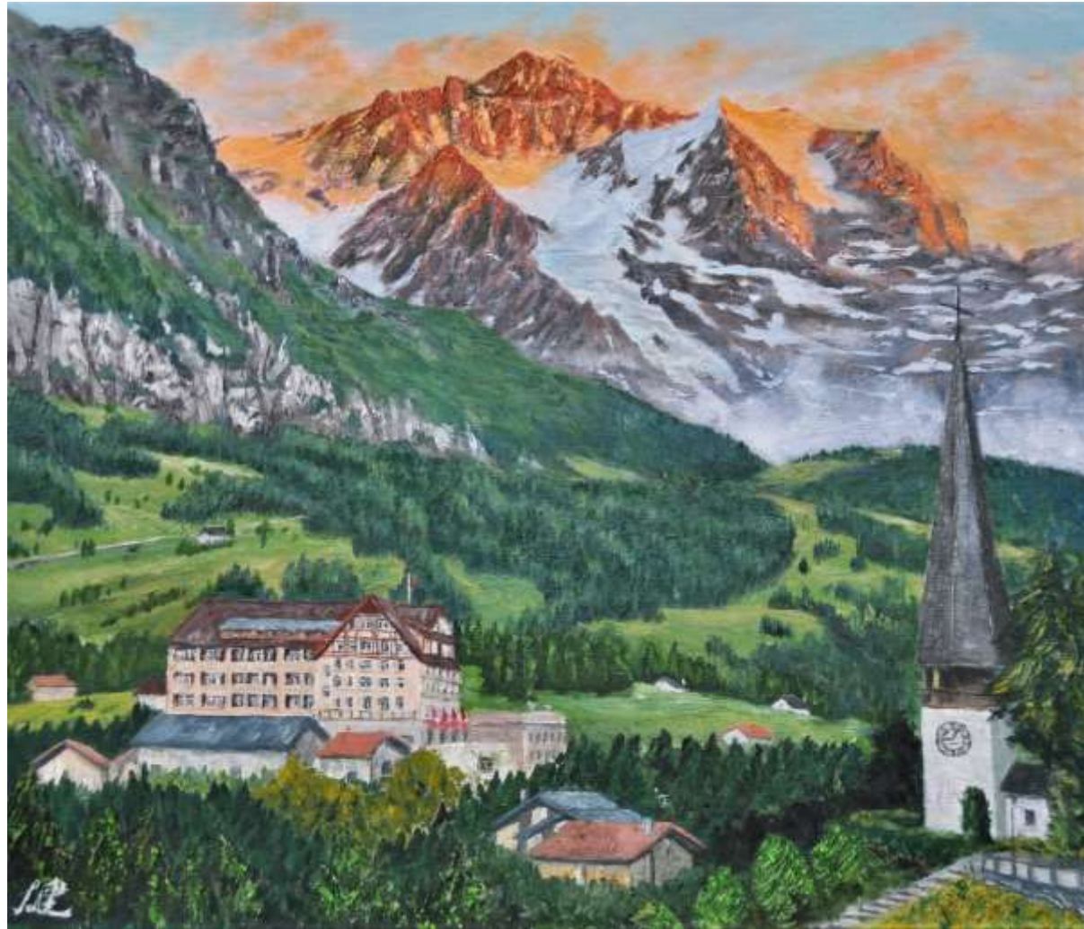
pic. 25 残照のユングフラウ F 10号 2017

森の中の町ヴェンゲン。夕食後、ガイドに聞いた教会のある展望台に行くと、ユングフラウの大きな姿が見えた。すでに午後9時になろうとしているのに残照を浴びて輝いていた。