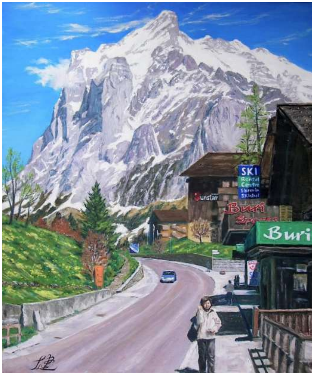
pic. 22 グリンデルワルトにて F 20号 2009

グリンデルワルトの村から一番目立つ山はアイガーではなく、ヴェッターホルンである。街のある谷間から一気に突き上げる北壁の上に頭をもたげたように頂上が見える。