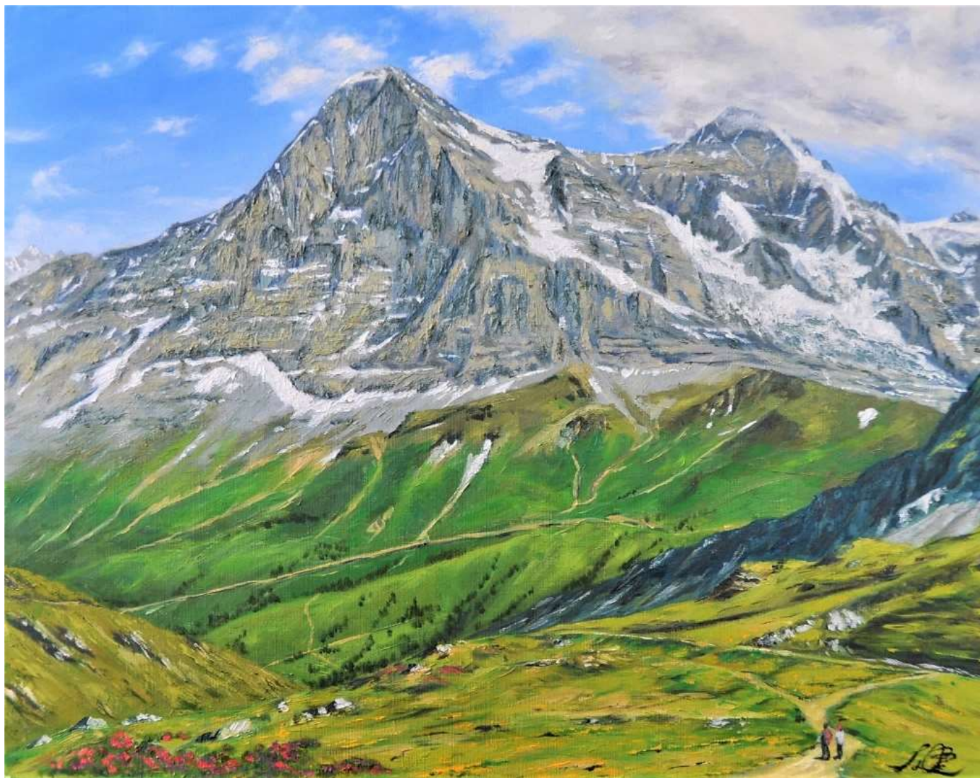
pic. 28 メンリッヒェンからのアイガーとメンヒ P 10号 2018

ヴェンゲンからロープウェーに乗ってメンリッヒェンへ。ここからクライネシャイデックへ下るハイキング道はアルプスを代表する草原とお花畑の道。正面にアイガーヴァント（北壁）が屹立している。