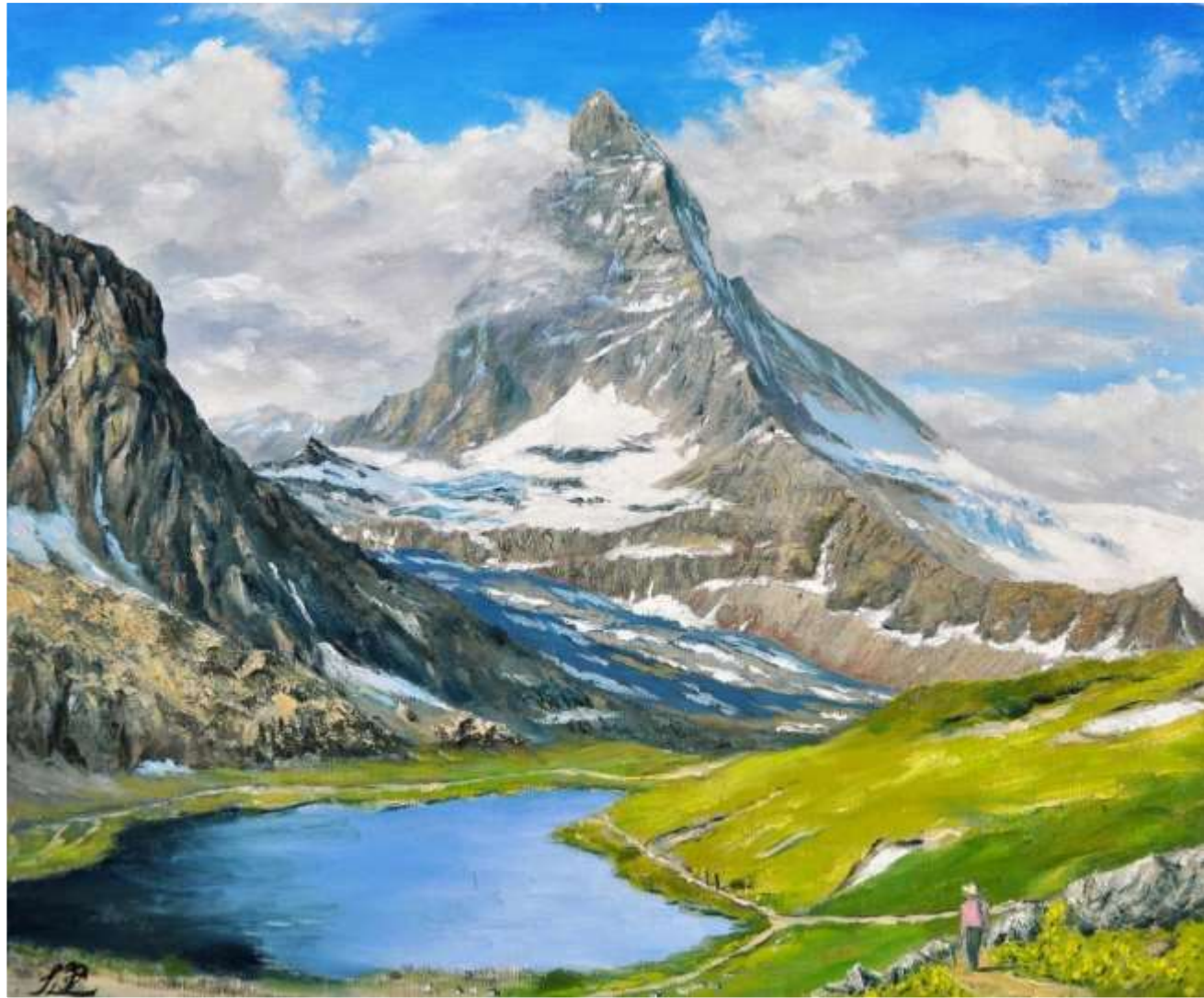
pic. 30 リッフェルゼーにて P 8号 2018

ゴルナーグラート登山鉄道のローテンボーデン駅で途中下車して少し歩くとリッフェルゼーにでる。マッターホルンが逆さに水面に映ること有名な池であるが、あいにく犬が池で泳いでいて波が立って見るができなかった。