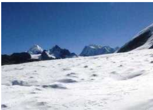
KG-23 and 22 from the Deeper Ata Kang La