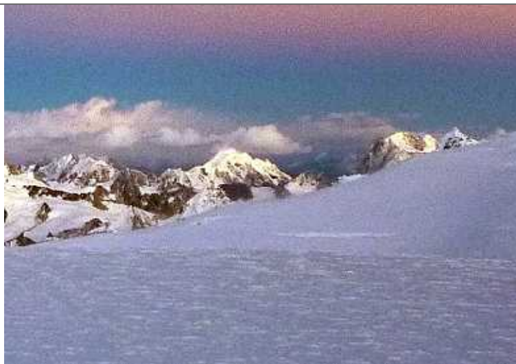
KG-23 and 22 from Camp-3(5910m) of Lopchin Feng