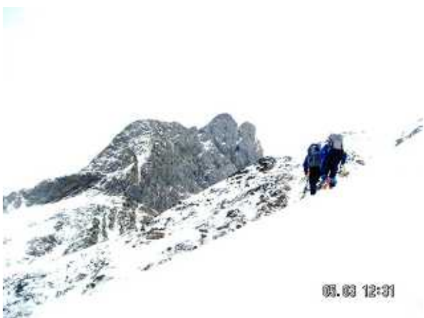
PH-9 小窓尾根から小窓の王を目指して