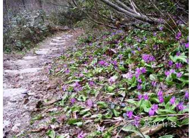
PH-16 早月尾根のカタクリ群落がお見送り