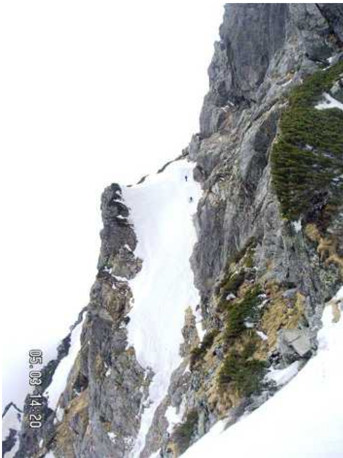
PH-11 小窓の王、後続パーティの懸垂下降。