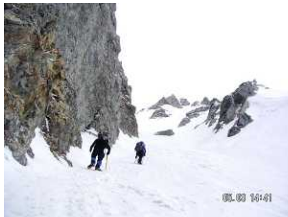
PH-12 凍った池ノ谷ガリーの登行。