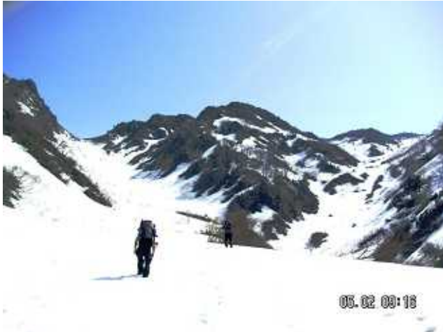
PH-1 ブナクラ谷右股をつめる

2009年5月2日 快晴：富山県警山岳警備隊事務所に入山届けをして、発信機「ヤマタン」を借りる。馬場島6：40発。雪が少なくブナクラ谷の下部は夏道を利用、ついでにコゴミ採取。上部は右股をつめて稜線へ10：45着。急な雪面をひたすら登り、キャンプ予定の赤谷山に12：50着。まだ早いので先に進み、赤ハゲ14：30。ここから先は岩と雪庇の境目を辿ることになる。明日の朝、雪の締まった時に通過することにして、赤ハゲ山頂を整地しテントを張る。毛勝三山の絶好の展望台。夕食にコゴミ入り炊き込みご飯。