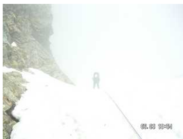
PH-10 小窓の王の懸垂下降 石丸君いわく「奈落のそこへ降りていくみたい」