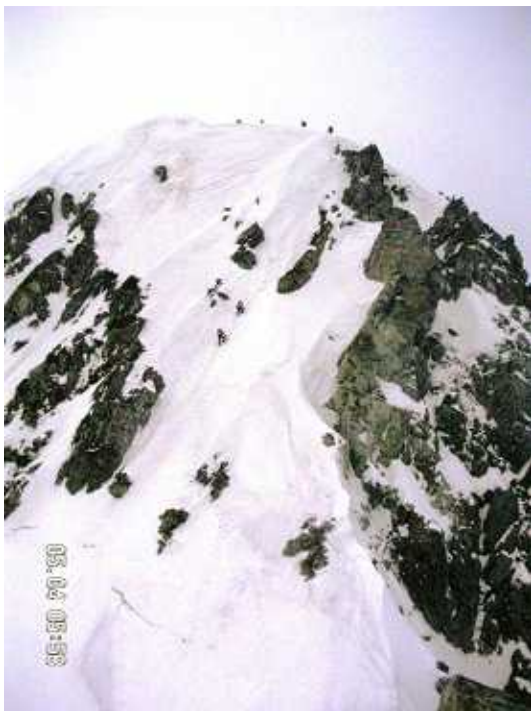
PH-14本峰への最後の急な雪壁

4日 曇り時々晴れ：池ノ谷のコルを5：30発。長次郎の頭付近の雪稜は思っていたより快適で、最後の急な雪壁をピッケル・バイルを頼りに登り切ると、剣岳山頂到着6：30。早月尾根上部の岩場でルンゼ内が氷化していたので懸垂下降25m。雪が安定していたのでほとんどの岩峰は池ノ谷側をトラバース。2750m付近のブッシュ混じりの雪壁を25m懸垂下降するが少し足りず、もう一回懸垂下降。9：00にやっと安全地帯の早月小屋に到着。ここからは、若者にとっては楽勝、中高年には苦行難行の下り。でも最後は可憐なカタクリの花群落が見送ってくれた。馬場島12：20到着。