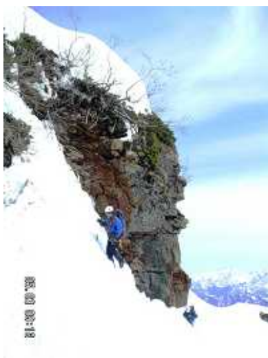
PH-7 池平山へのルート