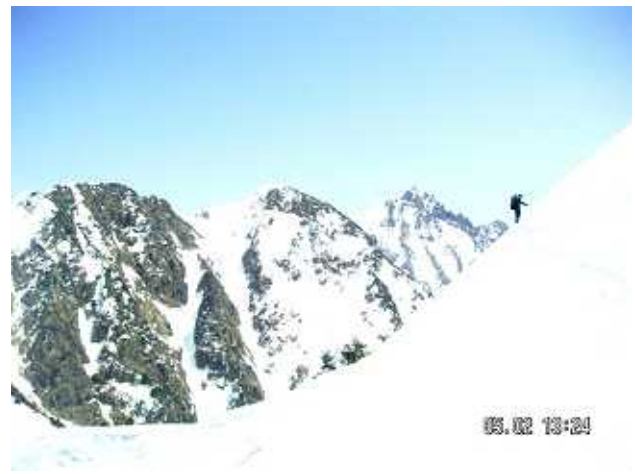
PH-2 白萩山をトラバース:左端、赤ハゲ頂上でキャンプ