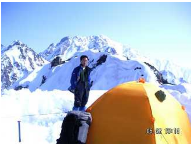
PH-3 赤ハゲ頂上キャンプ:剣岳山頂まで遠い