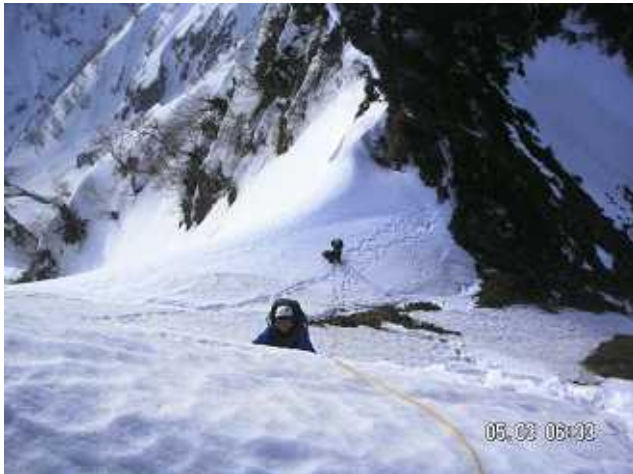
PH-5 白ハゲの下り。慎重にスタカット