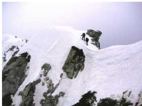
PH-13 剣岳本峰に向けての雪稜