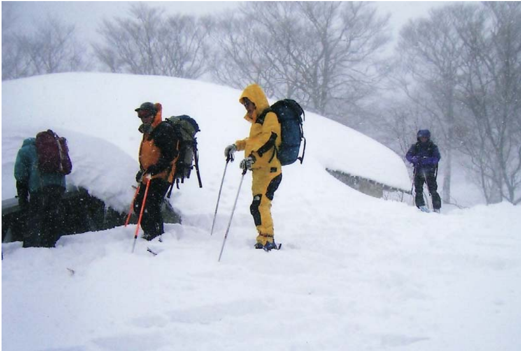
(千本杉ヒュッテのテラスは雪洞状態)

2月24日(雪) 8:20 千本杉ヒュッテ 9:05 一ノ谷出合い 10:25 東尾根避難小屋 12:25 氷ノ山国際スキー場リフト終点