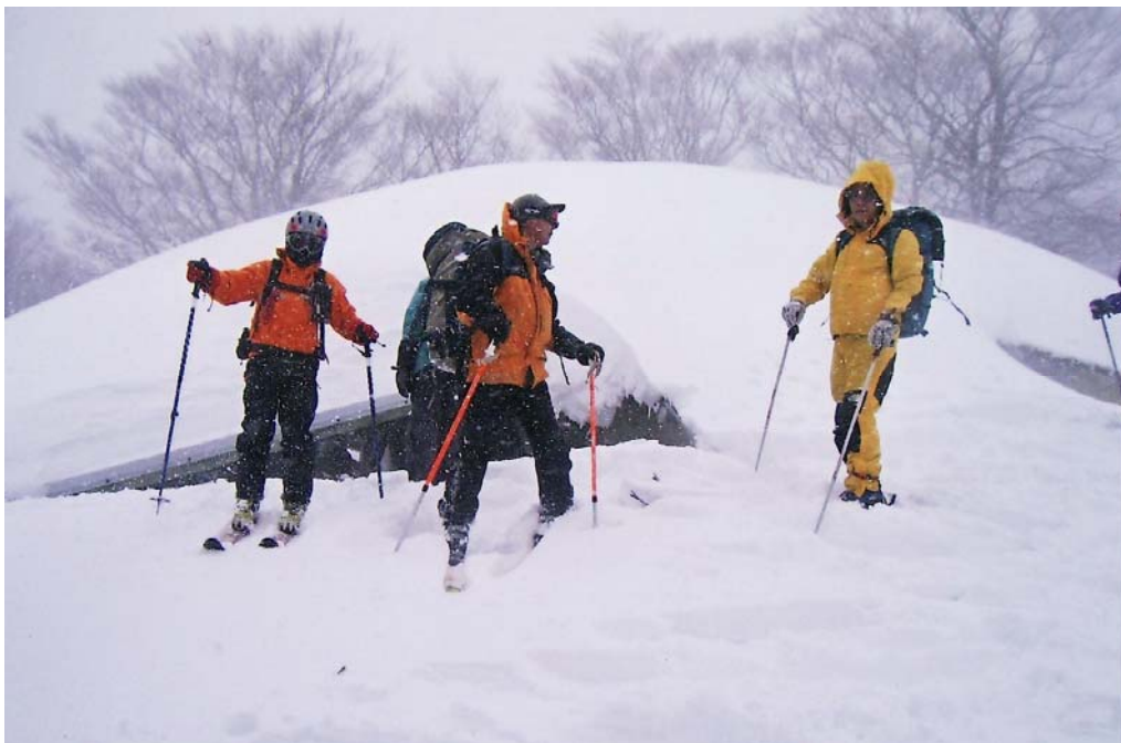
(今冬は雪が多い、千本杉ヒュッテは雪に埋もれていた。)

小屋の入り口を掘り出したりするうちに全員無事に到着となる。夜は皆さんの持ち上げた食材、酒で盛大な宴会となる。